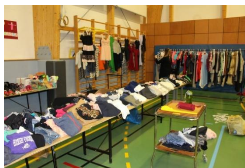
Mynd 2 og 3. Markaðsdagur Bæjarhellunnar.