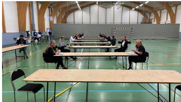
Mynd 4. Borðhald á tímum covid.

Til að meta árangur og skólastarfið almennt er skólinn í samstarfi við Skólalandsmótun sem gerir árlega kannanir fyrir grunnskóla landsins. Skólalandsmótun gerir nemendakönnun í október og apríl og foreldrakönnun og starfsmannakönnun að vori til skiptis annað hvert ár. Einnig framkvæmir Skólalandsmótun samantekt á niðurstöðum á samræmdum prófum skólans. Þessar kannanir eru unnar af fagmönnum og gefa mikilvægan samanburð við aðra skóla þar sem stór hluti grunnskóla landsins tekur þátt í þessum könnunum. Vegna COVID-19 fór skipulag úr skorðum og var einungis lögð fyrir nemendakönnun í október þetta skólaár. Engin foreldrakönnun fór fram. Litið er á alla fundi sem haldnir eru vegna skólastarfsins sem mikilvæga liði í mati á því starfi sem fram fer innan skólans.